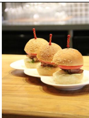
烟肉蘑菇芝士迷你汉堡 Mini Burger Trio with Cheese, Bacon, and Mushroom (人民币¥58)