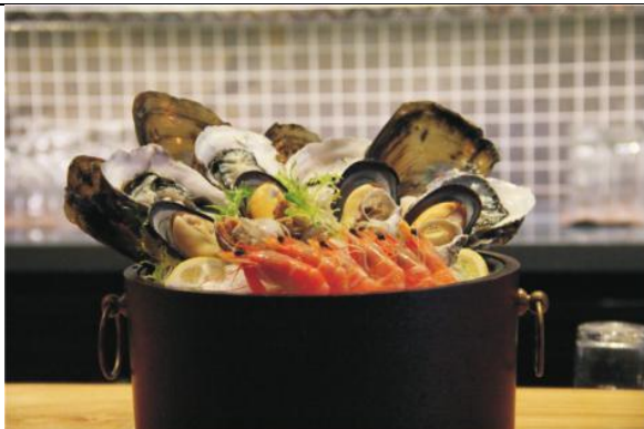
综合海鲜桶 Seafood Bucket (人民币¥168)