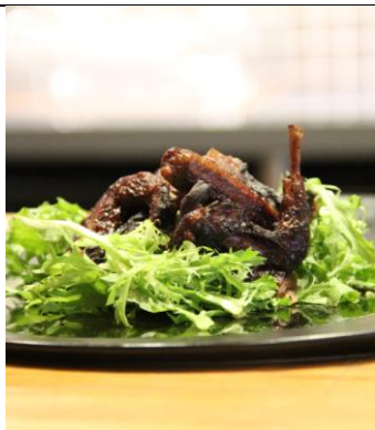
蜜汁意式黑醋烤乳鸽 Roasted Honey Balsamic Pigeon (人民币¥78)