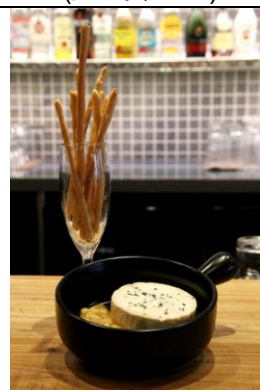
金文不芝士配啤酒棒棍 Melted Camembert with Grissini Sticks (人民币¥38)