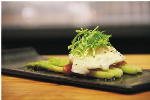
意式火腿芦笋卷配温泉蛋松露油醋汁 Grilled Asparagus with Prosciutto, Poached Egg, and Black Truffle Vinaigrette (人民币¥48)