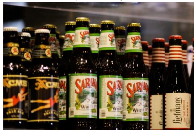
进口啤酒 Imported Beer

中国江苏省苏州市姑苏区乔司空巷27-33号(观前街粤海广场) 邮编: 215005