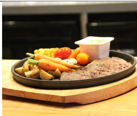
碳烤牛扒配烤蔬菜 Grilled Skirt Steak with grilled vegetables (人民币¥138)