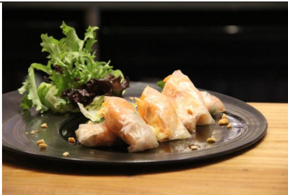
越南鲜虾卷 Vietnamese Shrimp Roll (人民币¥58)