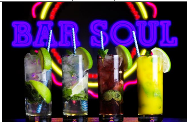
创意莫吉托 Signature Mojito