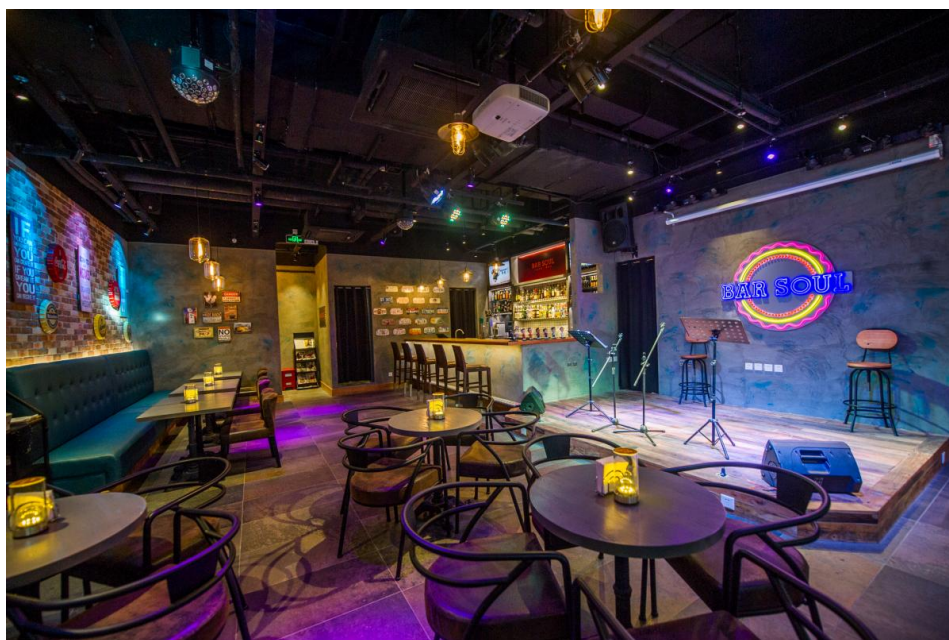
室内照片 Interior photos

中国江苏省苏州市姑苏区乔司空巷27-33号(观前街粤海广场) 邮编: 215005