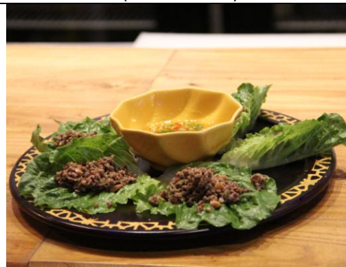
泰式牛肉生菜包 Thai Beef Lettuce Wrap (人民币¥48)

中国江苏省苏州市姑苏区乔司空巷27-33号(观前街粤海广场) 邮编: 215005