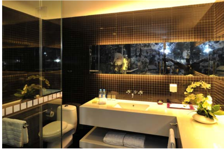
结合苏州园林设计的客房卫生间