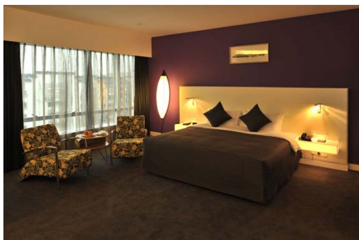
设备齐全及宽敞的酒店商务大床房