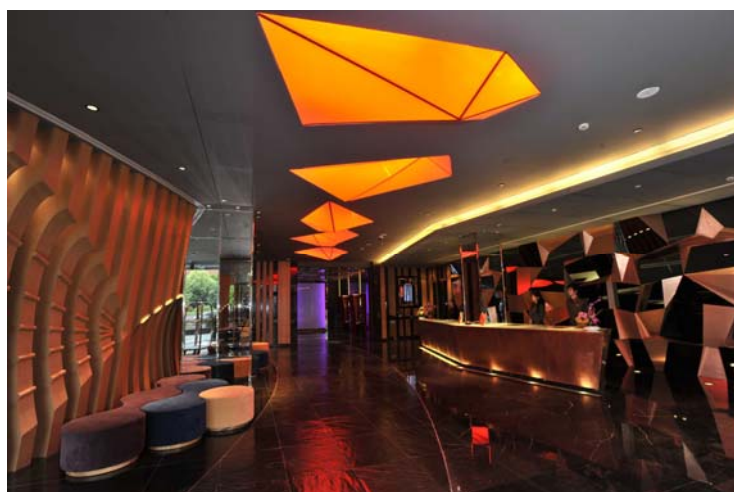
充满时尚气息的酒店大堂