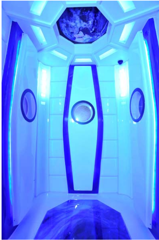
充满惊喜的‘太空舱’带客人抵达每个楼层