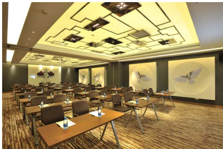
主题艺术品布满会议室