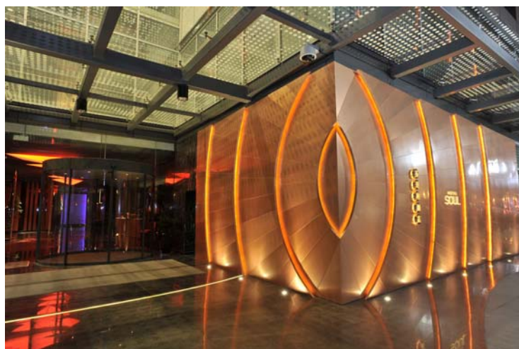
设计新颖的酒店大门入口