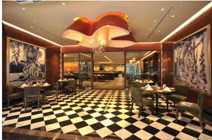
苏州首家法式餐厅「一零一法国餐厅」